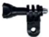
switch support 1