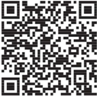
Android (Google Play Store)

Naskenujte QR kód pro instalaci mobilní aplikace.