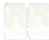
3M adhesive pad