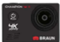
BRAUN® Champion 4K III Action-Camera